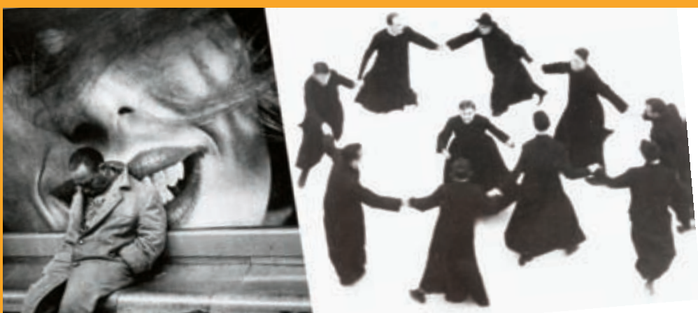
Ciochard nel metro, 1963