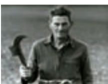
Contadino italiano a Sansepolcro, paese di Piero Della Francesca

Palazzo Ducale - Appartamento del Doge 6 giugno - 26 agosto 2012 Yves Klein. Judo e Teatro Corpo e Visioni A cinquant'anni dalla morte di Yves Klein, una mostra organizzata da Teatri Possibili Liguria e incentrata sulla tematica del Judo, momento focale della spaziantezza poetica dadaista del grande artista francese. Da un'idea di Sergio Maifredi, uomo di teatro e cintura nera di judo, e Bruno Corà, critico d'arte, l'esposizione prevede documenti, oggetti, immagini e video testimonianze inedite provenienti dagli Archivi Klein di Parigi e da collezioni private. Orario: 11/19 da martedì a domenica, chiuso lunedì. Ingresso: intero €6,00 - ridotto €5,00. Con Torre e carceri e mostre fotografiche €9,00.