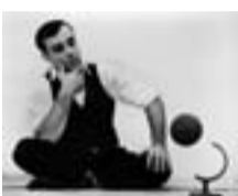
La Terre en lévitation