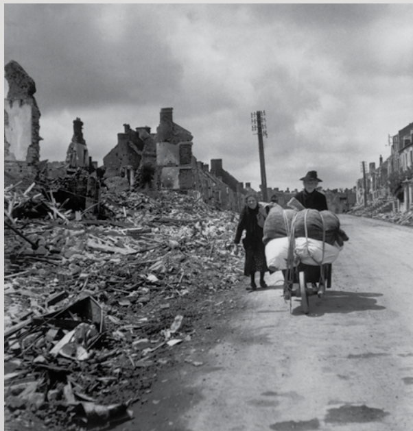
Manche. Pont l'Abbé. 15 giugno 1944. Civili tornano a casa dopo i combattimenti.

Ingresso gratuito durante La Storia in Piazza