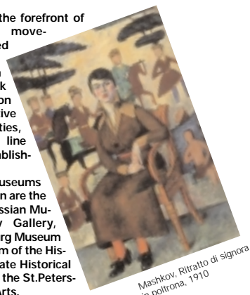
Mashkov. Ritratto di signora in poltrona, 1910