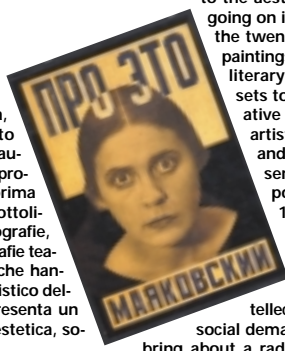
Rodchenko. Progetto di copertina, 1923

The exhibition is both a study and a sincere homage to twentieth-century Russian culture on the part of Genoa. The city of Ekaterinburg, which is twinned with Genoa, deserves special recognition for its kind cooperation and generosity in lending works from its Museum of Fine Arts.