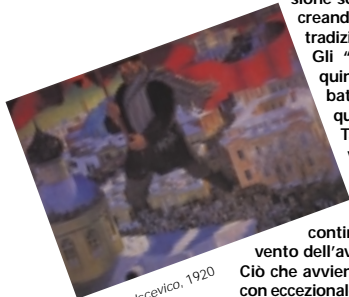
Kustodiev. Il Bolscevico, 1920