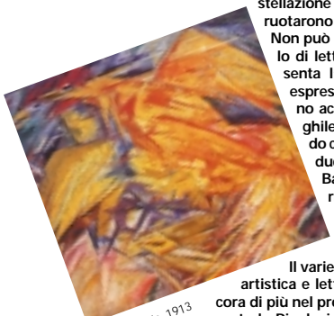
Larionov. Il gallo, 1913