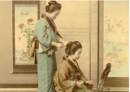
Kusakabe Kimbei (attr.), Geisha che si specchia mentre si fa acconciare i capelli, 1899 ca.

Fino al 25 agosto GEISHE E SAMURAI. Esotismo e fotografia nel Giappone dell'800