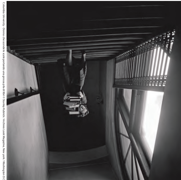
Canonica University. Donna che scende le scale portando un processo di legge. © Stanley Kubrick / Archivio Look Magazine, New York / Washington D.C.