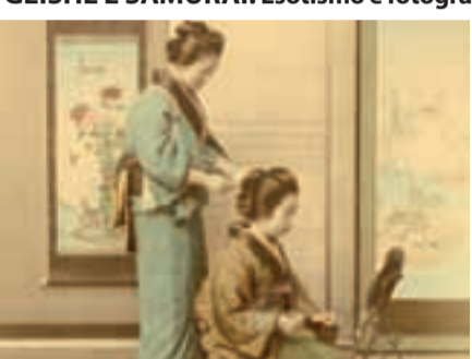
Kusakabe Kimbei (attr.), Geisha che si specchia mentre si fa acconciare i capelli, 1890 ca.

Fino al 25 agosto GEISHE E SAMURAI. Esotismo e fotografia nel Giappone dell'800