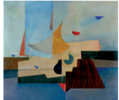
Otto Hofmann, Komposition, 1932, olio su tela, Städtische Museum Jena, Verksammling

Otto Hofmann. La poetica del Bauhaus a cura di Giovanni Battista Martini Appartamento del Doge Genova ricorda i 90 anni dalla nascita del Bauhaus con l'importante retrospettiva dedicata ad un artista tedesco tra i più interessanti del gruppo che condivise quell'esperienza didattica. 900 opere, tra cui molte mai esposte. Orario: 9/19 da martedì a domenica, lunedì chiuso. Info tel. 010.5574064 / 065 www.palazzoducale.genova.it Ingresso: €8,00 intero; €6,00 ridotto; €3,00 scuole. Visite guidate alle ore 15.30 tutte le domeniche