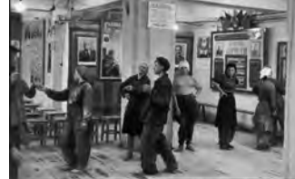
Mosca, Unione Sovietica, 1954

Palazzo Ducale Piazza Matteotti, 9 16123 Genova palazzoducale@palazzoducale.genova.it www.palazzoducale.genova.it