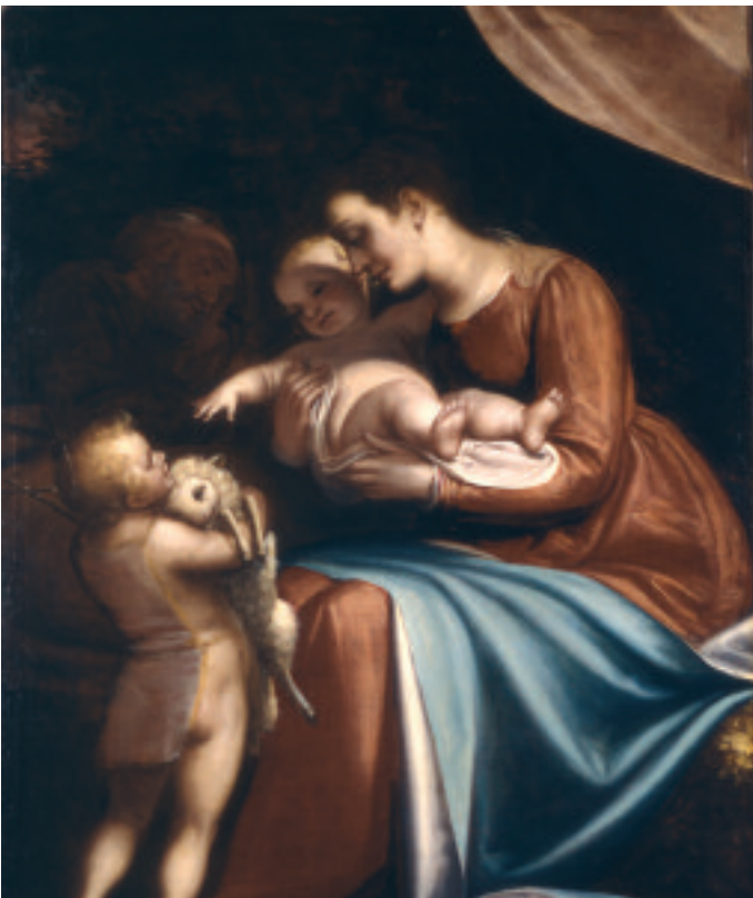
Luca Cambiaso - Sacra Famiglia con San Giovannino Edimburgo, National Gallery of Scotland

Luca Cambiaso, è senza dubbio l'artista ligure internazionalmente più noto, grazie alla complessità della sua esperienza artistica, alla sua qualità di disegnatore e soprattutto alla sua opera all'Escorial che ne conferma la notorietà nel panorama del tardo Cinquecento europeo. Il carattere di esemplarità del pittore ligure nel suo rapporto con i grandi maestri del Cinquecento e la sua dimensione europea, sono i presupposti di questa importante iniziativa espositiva che, a distanza di 50 anni dell'ultima mostra monografica, offre al pubblico una ampia selezione di opere che rivelano in modo completo le scelte del pittore e che permettono di seguirne l'itinerario artistico dall'esperienza giovanile fino all'attività per la corte spagnola.