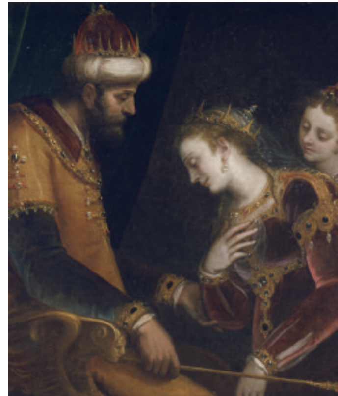
Luca Cambiaso - Esther e Assuero - Austin, Blanton Museum of Art

sequenza di sezioni che ripercorrono cronologicamente l'esperienza pittorica di Luca Cambiaso. A partire dal contesto degli anni Trenta del Cinquecento con la presenza dell'insegnamento dei grandi maestri, l'attenzione punta sempre più sullo specifico della vivace sperimentazione