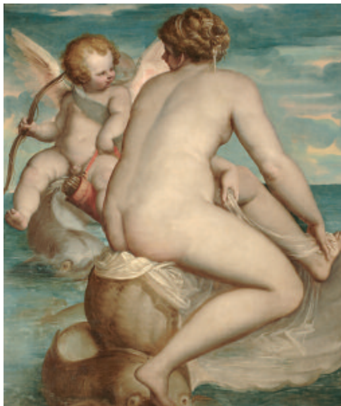
Luca Cambiaso - Venere e Amore sul mare - Roma, Galleria Borghese

Contemporaneamente al rivelarsi dell'attività dell'artista, Genova vive un momento di formidabile sviluppo del suo ruolo economico e politico, inserita in un circuito che lega i grandi centri del potere europeo. Cambiaso opera proprio in quel momento di eccezionale protagonismo della città, agli inizi della stagione nella quale l'aristocrazia genovese vuole e riesce a mostrare il ruolo internazionale raggiunto: lo testimoniano l'eccezionale sviluppo edilizio con la diffusione di una originale tipologia di ville e palazzi, recentemente riconosciuti dall'UNESCO con l'iscrizione nella Lista del Patrimonio Mondiale del sito "Genova: le Strade Nuove e il sistema dei Palazzi dei Rolli", e la coeva necessità di esprimere una grande decorazione che attraverso iconografie appropriate