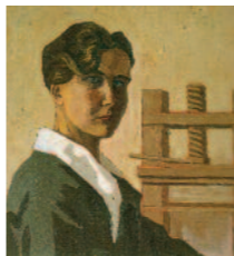
Mimi Quilici Buzzacchi - Autoritratto al torchio, 1926. Archivio Mimi Quilici Buzzacchi, Roma

Orario: da lunedì a venerdì 10/18; sabato e domenica 15/18. Ingresso libero