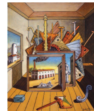
Giorgio de Chirico, Interno metafisico con officina , 1969, olio su tela, cm. 64,5 x 53,5, Fondazione Giorgio e Isa de Chirico, Roma, inv. 276

Altre Metafisiche. Carrà, Savinio, Sironi e gli altri