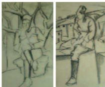
Achille Funi Soldato che fuma la pipa, 1918. Collezione privata, Milano