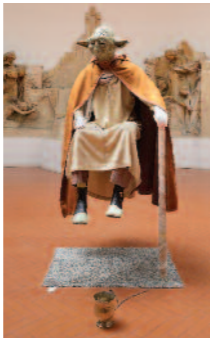
Claire Fontaine - Yoda, 2016

Orario: 15 /19 da martedì a venerdì; 11/19 sabato e domenica; chiuso il lunedì