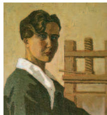
Mimi Quilici Buzzacchi - Autoritratto al torchio, 1926, Archivio Mimi Quilici Buzzacchi, Roma

Orario: da lunedì a venerdì 9/19; sabato e domenica 15/18 Ingresso libero