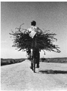
Fulvio Roiter - Sulla strada Gela Nisicemi, Sicilia 1953

Orario: da martedì a domenica 10/19, chiuso il lunedì. La biglietteria chiude alle 18 e si trova all'ingresso della mostra nella Loggia degli Abati