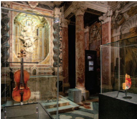
a sinistra: Bartolomeo Giuseppe Guarneri, Violino "Cannone" di Paganini, 1743 Palazzo Tursi, sede del Comune di Genova

Incandescente come Jimi Hendrix Palazzo Ducale Appartamento del Doge Palazzo Ducale dedica a Niccolò Paganini una grande mostra con l'intento di raccontare, attraverso una narrazione contemporanea, multimediale e suggestiva, la vita del celebre musicista genovese mettendo in risalto tutta la sua attualità. Un racconto inedito, che si snoda attraverso l'esposizione di manoscritti autografi, proiezioni di forte impatto visivo e ascolti musicali, nell'idea che Paganini sia un artista profondamente legato alla nostra contemporaneità, una vera e propria rockstar, tanto che il confronto con Jimi Hendrix non risulta poi così inaudito. La scoperta del talento, il virtuosismo, le performance, il look, i tour, la fama, lo scatenamento di fantasie ed entusiasmi del pubblico, sono tutti elementi ricorrenti in entrambi i musicisti, senza tralasciare la rivoluzione della musica che entrambi hanno avviato. Una rivoluzione che dura tutt'ora. La mostra è curata da Roberto Grisley, Raffaele Mellace e Ivano Fossati, allestimento di NEO Narrative Environments Operas, Milano.