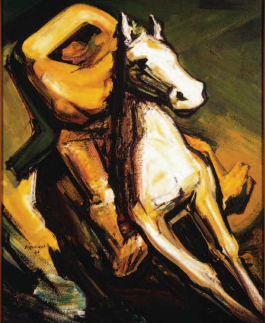
David Alfaro Siqueiros - Zapata, estudio para el mural del castillo de Chapultepec, 1966, Museo de Arte Carrillo Gil