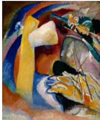
Wassily Kandinsky Studio per Dipinto con forma bianca / Study for Painting with White Form, 1913 - Olio su tela / Oil on canvas Detroit Institute of Arts, Gift of Mrs. Ferdinand Moeller

e Stefano Zuffi, la mostra è organizzata dal Detroit Institute of Arts, prodotta da Palazzo Ducale Fondazione per la Cultura in collaborazione con MondoMostre Skira ed è promossa dal Comune di Genova con il patrocinio del Ministero dei Beni e delle Attività Culturali e del Turismo, della Missione Diplomatica americana in Italia e dell'American Chamber of Commerce in Italy.