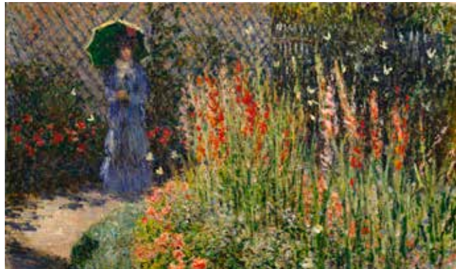
Claude Monet Gladioli, 1876 circa - Olio su tela / Oil on canvas Detroit Institute of Arts, City of Detroit Purchase

I grandi imprenditori diedero origine infatti ad una forma di