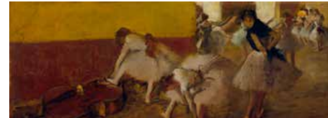
Edgar Degas Ballerine nella stanza verde / Dancers in the Green Room, 1879 circa - Olio su tela / Oil on canvas Detroit Institute of Arts, City of Detroit Purchase

the culture of the entire world. At the same time, the exhibition highlights the amazing adventure of American art collecting, which went hand in hand with the rapid growth of capitalism in the industrialized West. In effect, the great entrepreneurs created a kind of patronage that enabled the birth of a new cultural imagination, nourished by stimuli from the European avant-gardes, whose works were being acquired and exhibited by the Detroit Institute of Arts in those very same years.